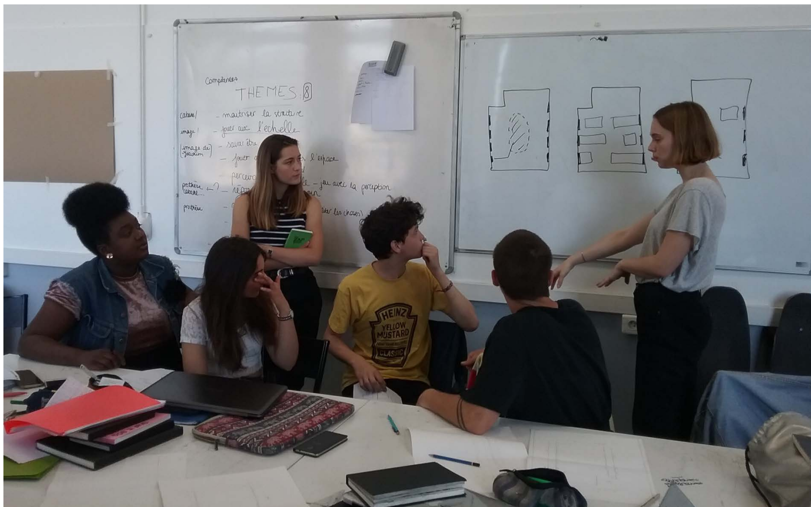
Préparation de l'exposition par le groupe d'étudiants. Licence 1 ère année, 2 e semestre, 31 mai 2017