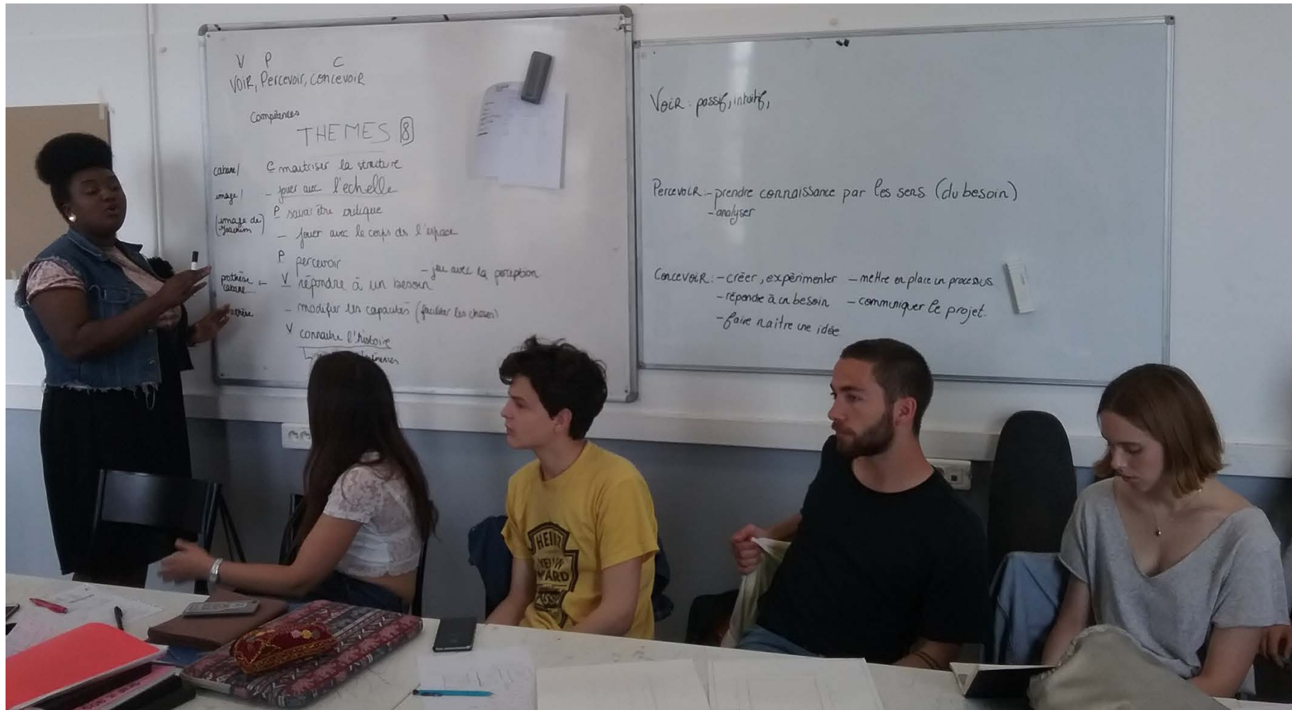
Préparation de l'exposition par le groupe d'étudiants. Licence 1 ère année, 2 e semestre, 31 mai 2017